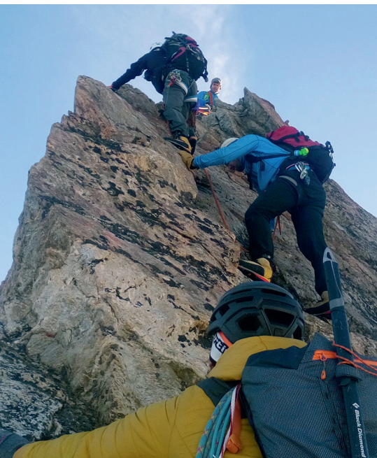
Bärglistock Kante; Fotos: Simon Tischhauser

Auch runter ging es danach wieder im ähnlichen Stil. Wir mussten immer konzentriert sein. Nach dem Grat hiess es wieder Steigeisen montieren und über eine teils schneebedeckte Rampe gings runter zum Gletscher. Als die Gletscherzunge fertig war, ging es ohne Steigeisen zu den «Augen», wo wir uns noch zweimal kurz abseilten. Danach hatten wir das Technische geschafft. Die Hütte war in Sichtweite und wir freuten uns auf eine kühle Erfrischung und feinen Kuchen. Nach der Stärkung nahmen wir den Abstieg zum Auto unter die Füsse. In Grindelwald machten wir noch einen Kaffeehalt bei