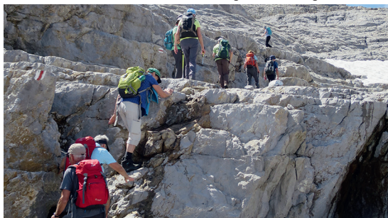
Sex Rouge – Teufelskegel