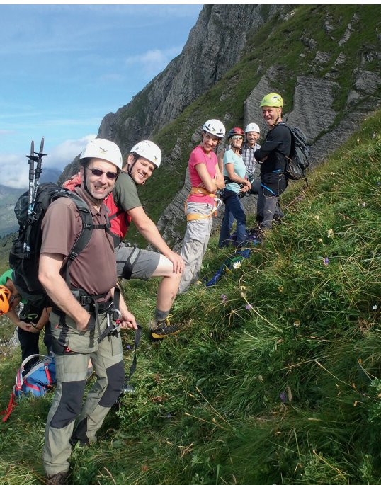
Aufstieg über die Chammegg

Eigentlich hätten wir schon genug Adrenalinschübe gehabt und die Tour abschliessen können; aber eben, der Tag war noch lang. So brauchte Stefan nicht viel Überzeugungskraft um uns für einen unkonventionellen Abstieg nach Sargans zu begeistern. Wir machten uns also auf zum Follawald unterhalb des Gonzens und stiegen steil ab bis zum grossen Klemmblock. Dort liess uns Stefan Taschenlampe und Jacke auspacken. Und tatsächlich: Über ein unscheinbares Grasband führte er uns zum Eingang der Gletschergrube. Und damit nicht genug: Im Innern war es schon fast kalt, war doch trotz der Hitze der letzten Wochen der hereingewehte Schnee vom letzten Winter