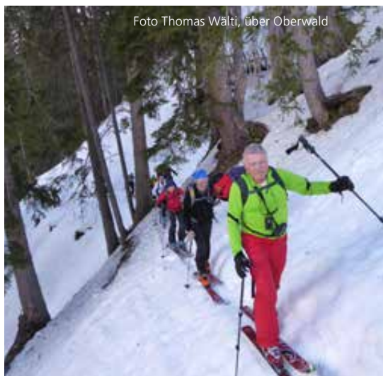
über Oberwald