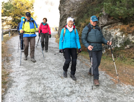
Der kalte Malojawind zwingt uns, uns warm anzuziehen

Bereits erkannten wir im Hintergrund das Restaurant Cavlocchio, wo wir nach Umrundung des Sees zu Mittag assen. Reichhaltig und sehr lecker war das Bestellte und jeder