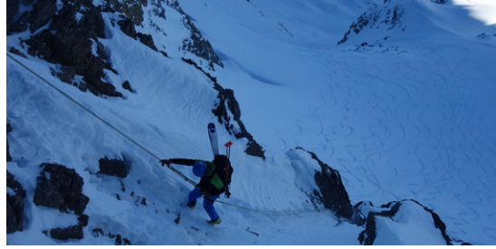
Abstieg vom Tüfelsjoch

Um 7.15 Uhr starten wir auf dem Urnerboden Richtung Klausenpass. Zuerst auf schöner Spur bis unters Rau Stöckli; ab Ende der Spur mussten wir selber ran. Schnell änderten sich nun die Schneebedingungen von Traumpulver zu windgepresst und eisig. Auch die Harscheisen konnten uns nicht sicher über alle Stufen bringen. Somit mussten wir ab und zu auf Fussmarsch setzen und mit dem Pickel ein paar Tritte schlagen. Bei besten Temperaturen und ohne Wind ging es übers Gletscherplateau zum Skidepot. Nach kurzer Stärkung aus dem Rucksack ging es mit Steigeisen an den Füssen und aufgebundenen Skis über den Vorgipfel zum Hauptgipfel des Clariden (3267 m). Es war ein angenehmer Aufstieg: alle Ketten lagen frei, je nach Exposition war der Fels trocken oder von Eis überzogen. Um 13.00 Uhr konnten wir unseren verdienten Z'mittag zu uns nehmen und das Panorama geniessen. Gestärkt ging es nun an die Abfahrt auf den Claridenfirn. Bester Pulver liess das Herz und auch den Skifahrer vor Freude jauchzen. Auf ca. 2760 m