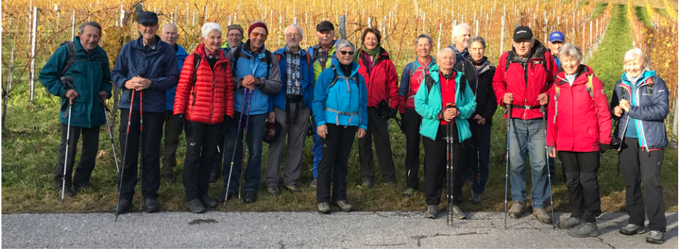
Die ganze Gruppe in Fläsch