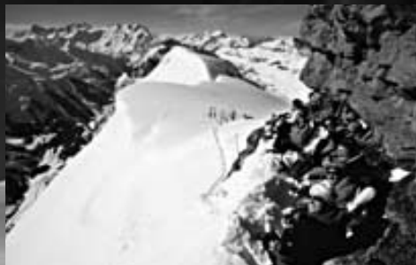
«Adlerhorst» am Mähren

Triftgletscher, Finsteraarhorn bis zum Wetterhorn.