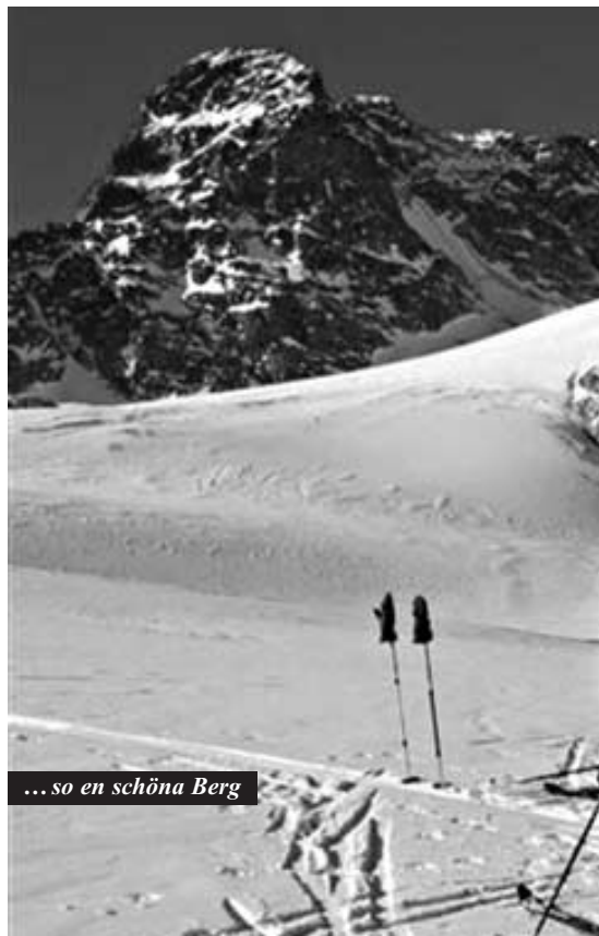
... so en schöna Berg

Am Donnerstag erscheint uns der Aufstieg zur Porta d'Es-cha (bei Postkartenwetter schon einmal die tolle Aussicht geniessen) ein Kinderspiel, gegenüber den Strapazen des Vortages. Aber es sollte noch anders kommen. Das Gipfelglück kann infolge Vereisung nicht geniessen werden. Aber vorerst einmal geniessen wir alle die Abfahrt über den Gletscher. Dann hinunter ins Val Tuors. Sulz gibt es nicht, Pulverschnee natürlich auch nicht, Bruchharsch mh, aber vor allem weichen Pflüder. Kaum einer wird von