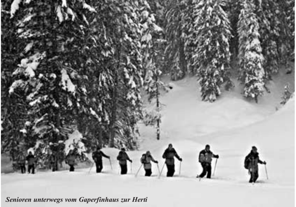
Senioren unterwegs vom Gaperfinhaus zur Herti