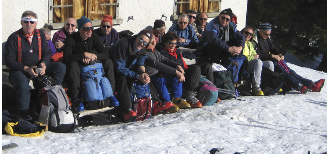
Der ganze Haufen (ohne Fotograf) beim Znüni auf Tamons.

Um 7.30 Uhr besammeln sich die Teilnehmer auf dem Dorfplatz Mels. Mit gutgefüllten PWs geht die Fahrt hinauf nach Vermol (1100 m). Die obligate Barryvoxkontrolle entfällt, da einige das Gerät zu Hause «vergessen» haben. Da muss der Samichlaus beim nächsten Chlausbummel eine ernste Ermahnung anbringen: Für die Skitour gehören Barryvox und Lawinenschaufel immer zur Ausrüstung!