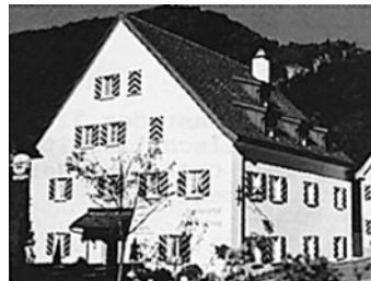
Das gemütliche Speiserestaurant in der Bündner Herrschaft