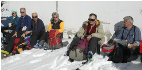
Rast bei der Höchstenhütte.

Diese hatten in rund dreieinhalb Stunden den etwas bekannteren Piz Daint (2968 m) bestiegen. Zwei traumhafte Pulverschnee-