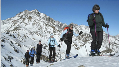
Aufstieg auf die Gleckspitze mit Eggenspitze im Hintergrund.