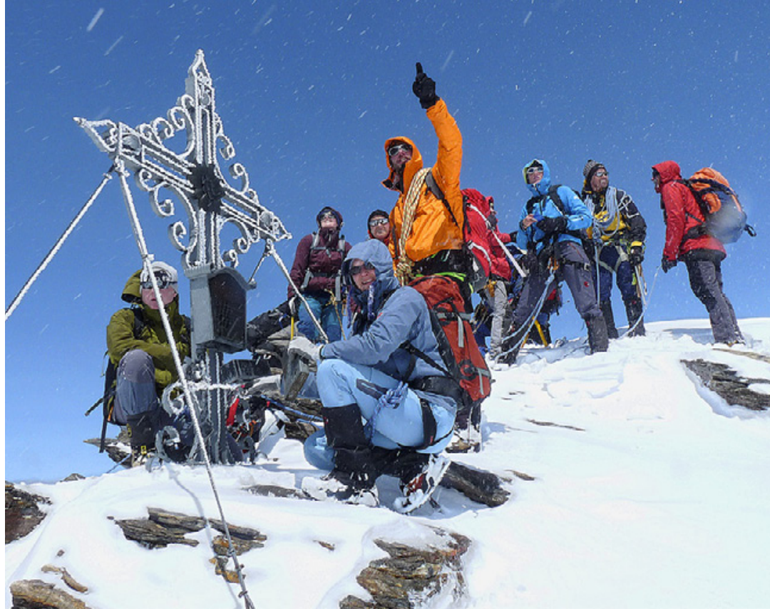
Hohe Riffel: Gipfelsieg bei Sonne.

Die erlösende Nachricht, man habe den Verunglückten noch in der Nacht gefun-