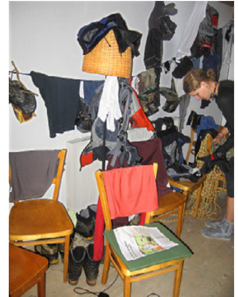
Kreatives Wäschetrocknen in Innerschlöss.

Nach einer kurzen Taxifahrt aus dem schönen Innerschlöss starten wir bei wunderbarem Wetter zu einem saftigen 2020-Hm-Aufstieg Richtung Granatspitz (3086 m). Wiederum ist uns das Wetterglück nur von kurzer Dauer beschieden: Regenwolken ziehen auf und Nebel erschwert die Orientierung. Kurz unter dem Granatspitz-Sattel beginnt es dann auch in Strömen zu regnen. Die Idee, trotz