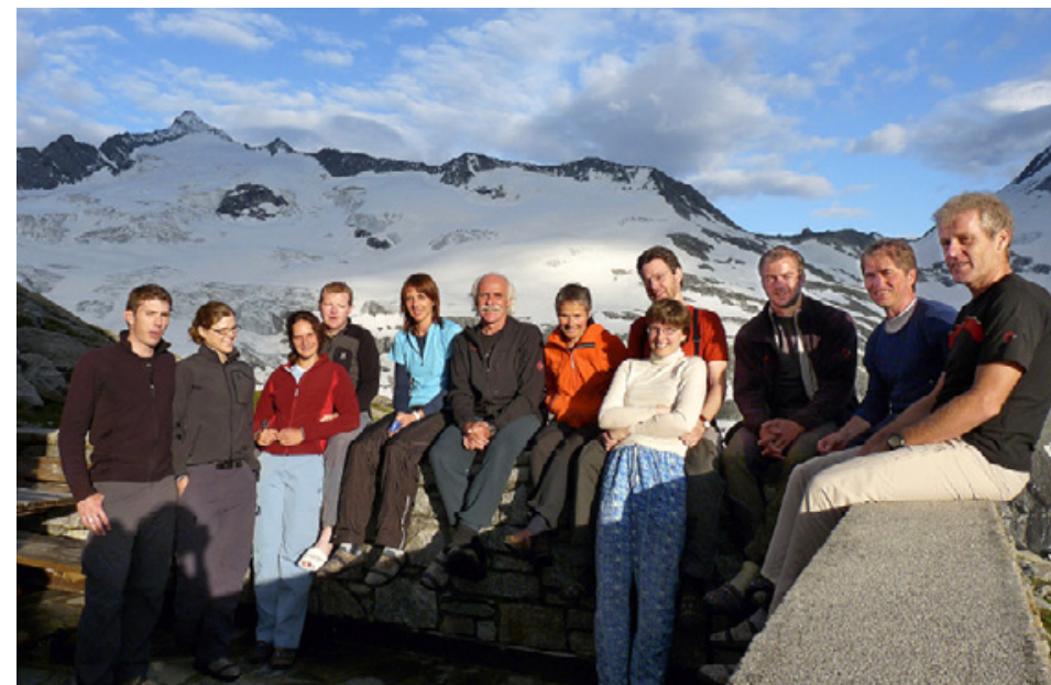
Am Anreisetag in der Kürsinger Hütte.