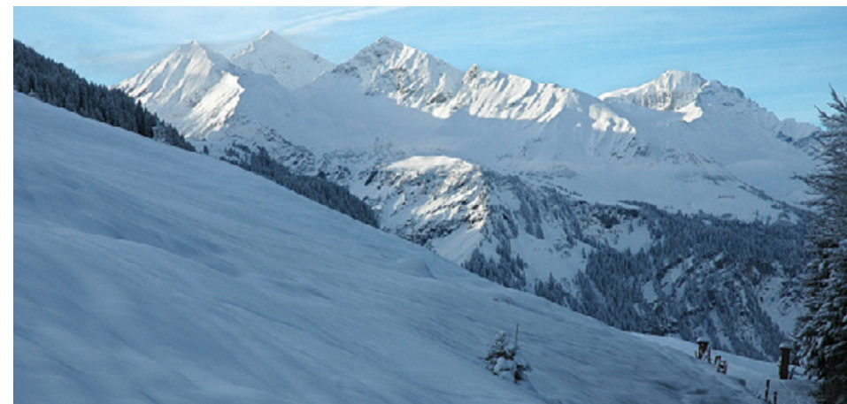
Blick vom Ebenwald ins Weisstannental: Hüenerspitz, Marchstein, Hangsackgrat, Laritschopf, Piz Sardona, Grossi Schiben, darunter Alp Valtnov (von links).

Kosten: Fr. 15.– Teilnehmerzahl: 17 Anmeldung: Mittwoch, 24. Februar 2010 an: Alfons Kühne Telefon 081 302 50 44 Auskunft: Dienstag, 23. Februar 2010 bis 20.00 Uhr Telefon 081 302 50 44