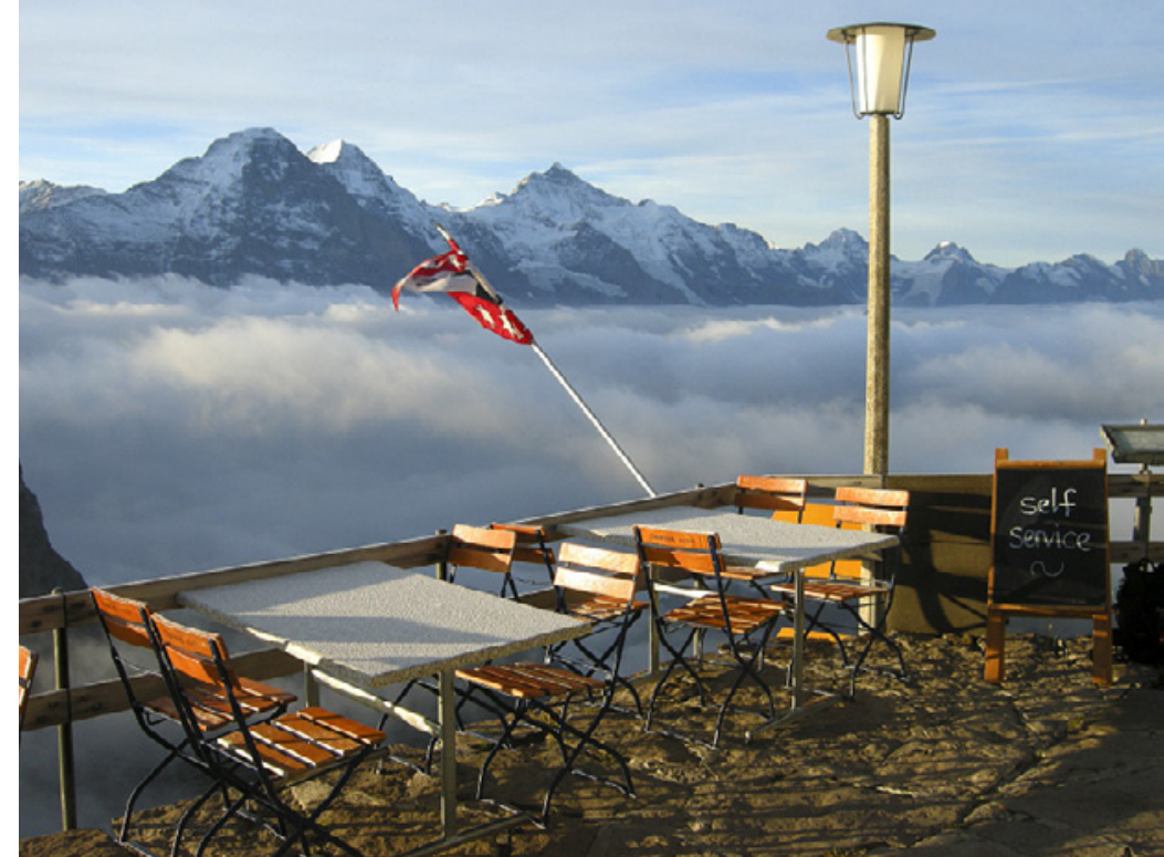
Eisiger Morgen auf der Terrasse.

Margrit gebührt unser herzlicher Dank für die gewissenhaften Vorbereitungen, die gute Organisation und die kompetente Führung.