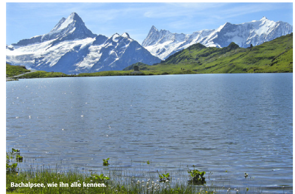
Bachalpsee, wie ihn alle kennen.