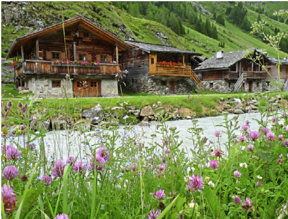
Innerschlöss: walserrähnliche Siedlung.