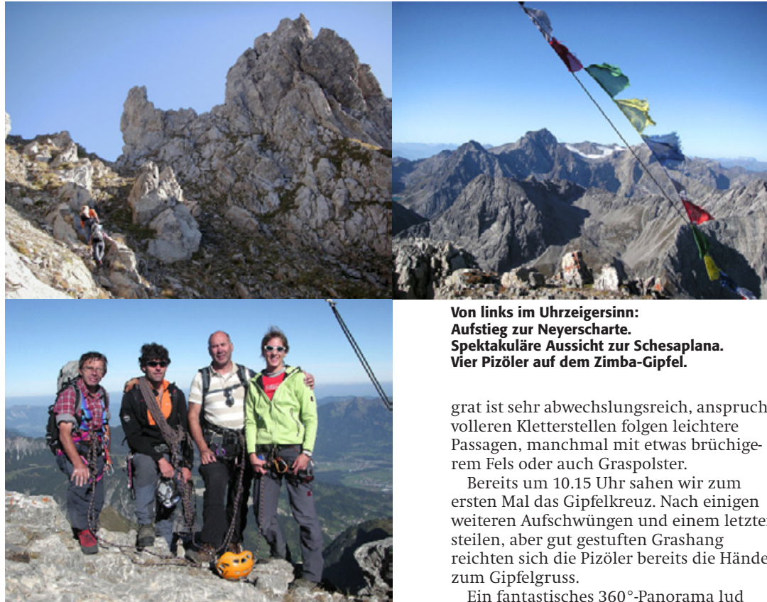
Von links im Uhrzeigersinn: Aufstieg zur Neyerscharte. Spektakuläre Aussicht zur Schesaplana. Vier Pizöler auf dem Zimba-Gipfel.

Am Morgen bewahrheitete sich wieder einmal die Beobachtung, dass sich west-alpen-gewohnte Berggänger von Ostalpen-Berggängern unterscheiden: Wir waren die