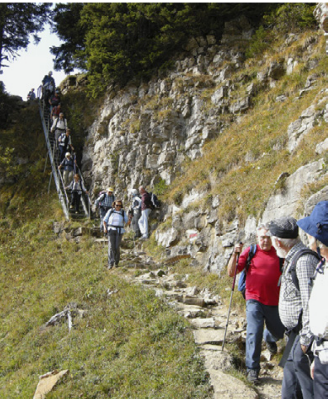
Treppe zum Oberberghorn.

Kurz vor 17 Uhr kommen wir im altherwürdigen Berghotel an, beziehen sofort die Schlafräume und ahnen noch nicht, dass uns eine kalte Nacht bevorsteht. Aus dem vielgepriesenen Sonnenuntergang wird nichts. Der Nebel bleibt hartnäckig. Umso mehr genießen wir das gute Nachtessen in der Wärme und sind uns bewusst, dass wir eine recht happige Bergtour hinter uns haben, sind es doch neben der beträchtlichen Länge an die 800 Höhenmeter, die wir überwunden haben.