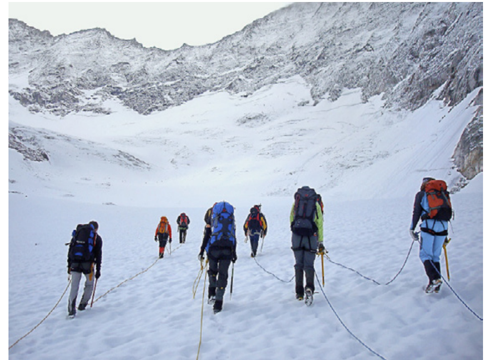
Aufstieg Hohe Riffel.