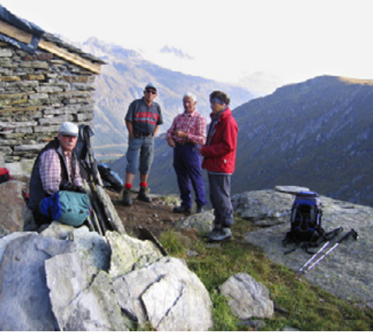
Aufstieg zum Piz La Margna.