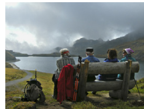
Am Bachalpsee: Wer ist wer...?

schlaflos durch den Kopf. Morgens um halb acht war ich wieder froh, teilgenommen zu haben. Wir staunten über ein meteorologisches Phänomen: eine Glorie. Schlotternd standen wir auf dem Gipfel und hofften, den Sonnenaufgang im gestern überwältigenden Panorama zu erleben. Den Zeitpunkt, 7.30 Uhr, listete die Wirtsfamilie neben dem Waschraum auf. Manchmal schien die Sonne den Nebel zu