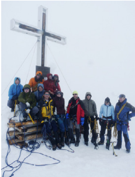
Auf dem Grossvenediger.

Der Aufstieg von der Kürsinger Hütte (2547 m) Richtung Grossvenediger (3667 m) gestaltet sich relativ einfach. Was unsere Freude jedoch etwas trübt, ist das zunehmend schlechte Wetter. Ein Gemisch aus Regen und Graupelschauern setzt ein. Kurz unter dem Sattel deponieren wir unsere Rucksäcke und stapfen tapfer durchs milchige Nebelmeer hinauf zum Grossvenediger. Die Aussicht auf dem zwischen Osttirol und Salzburg gelegenen Grossvenediger – übrigens der vierthöchste Berg in Österreich – ist aufgrund des schlechten Wetters wenig berauschend. Wir machen uns deshalb schnell wieder ans Absteigen. Unsere Rucksäcke erwarten uns bereits sehnelichst, sind doch viele schon ziemlich mit Wasser vollgesogen.