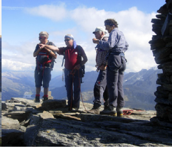
Piz La Margna.