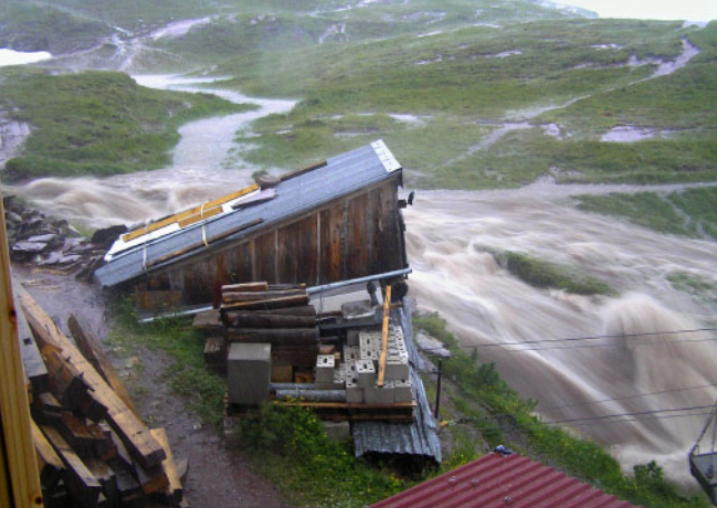
Bach bei der Seilbahn.

uns rund um die Hütte. Die ersten Bänke wurden schon nach kurzer Zeit durch die Luft gewirbelt und das machte uns deutlich, dass sich da etwas zusammenbraute, was wir im Auge behalten mussten. Nicht, dass das auf unserer Höhe von fast 2100 m ü. M. wirklich selten wäre – doch die Stärke des Unwetters war ungewöhnlich.