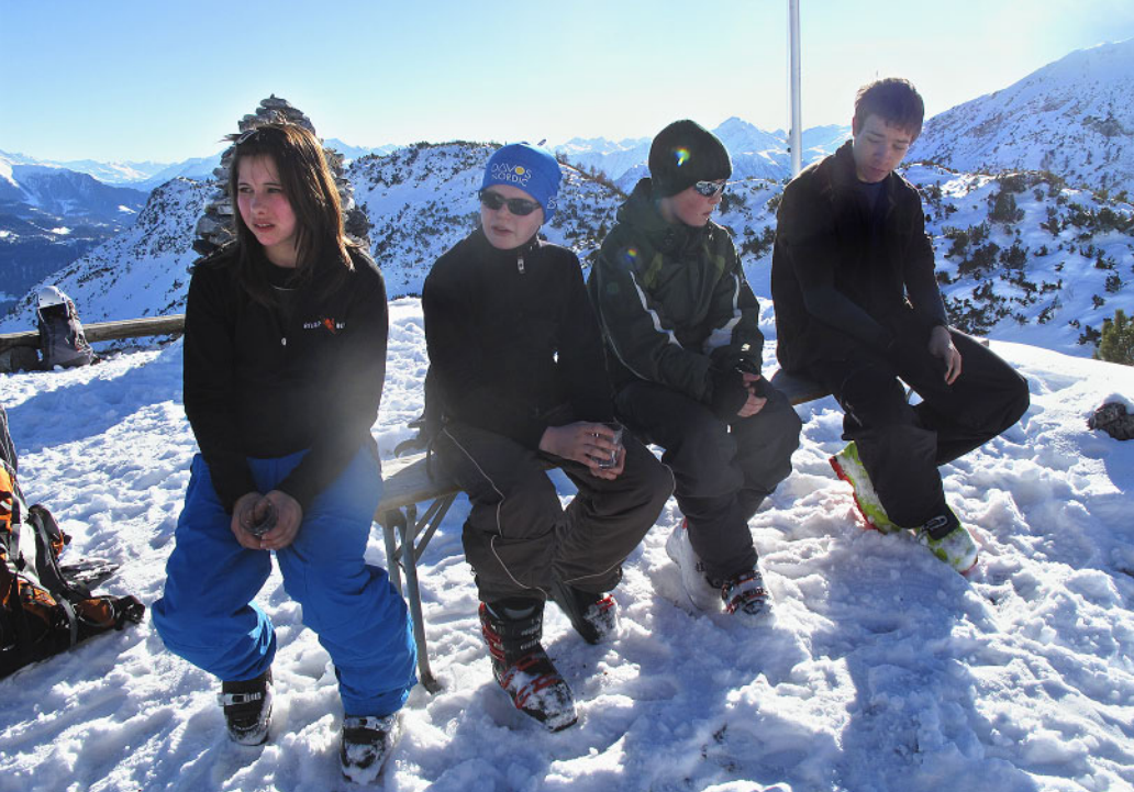
Die KiBeler auf der Silvestertour 2010 auf der Terrasse der Ringelspitzhütte.

gut mit uns gemeint hat. Bei schlechter Witterung gingen wir in die zahlreichen Klettersteige, bei guter Witterung kletterten wir an schönem, griffigem Fels.