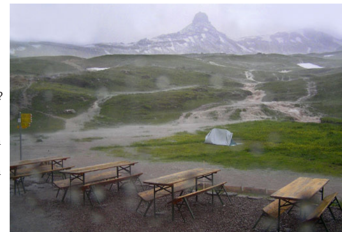
Aus Fusswegen werden Bäche.