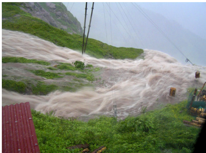
Seilbahn steht neu im Bach.

Geschehnisse draussen war eine echte Konkurrenz (grins) ... Alle in der Stube klebten an den Fenstern, die einen ungeahnten Schutz nach draussen boten. Nur sehr kurz haben wir gewagt, das Fenster zur Seilbahn zu öffnen, um ein paar Fotos zu machen. Heute bin ich froh darum, denn ich hätte am Ende selbst nicht mehr geglaubt, wie stark das Gewitter gewütet hat, wenn ich selbst nicht nochmals die Bilder gesehen hätte. Nach etwa einer Stunde war alles vorbei. Das Gewitter beruhigte sich, die Wassermassen gingen sichtlich zurück, die Stimmung