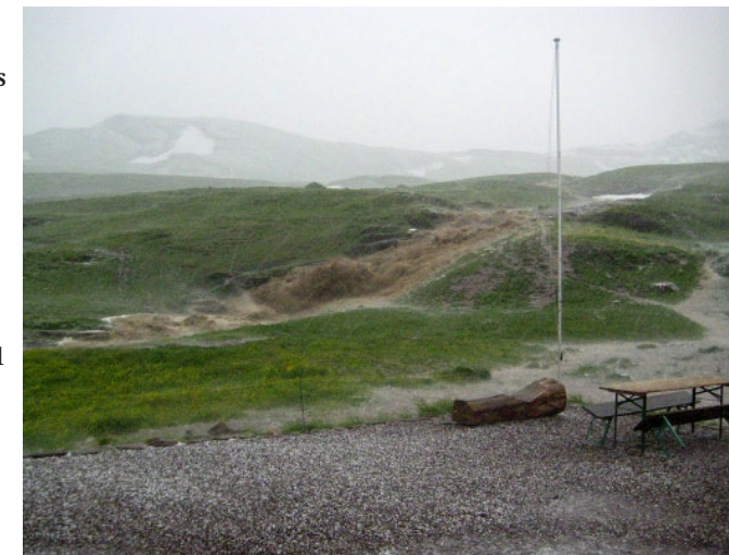
Bach beim Fahnenmast.

vor der Terrasse gemütlich eingerichtet hatte. Seine Idee war, sich etwas auf seinem Gaskocher zum Essen zu kochen und dann den Abend (es war ja ein wirklich schöner Sommertag) vor und in unserem Zelt zu geniessen. Auch für ihn kam es anders als gedacht.