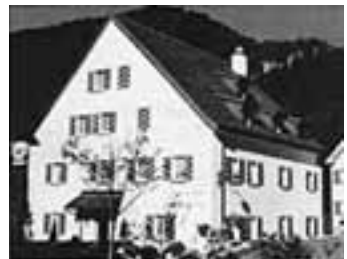
Das gemütliche Speiserestaurant in der Bündner Herrschaft