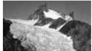
6 Gross Spannort